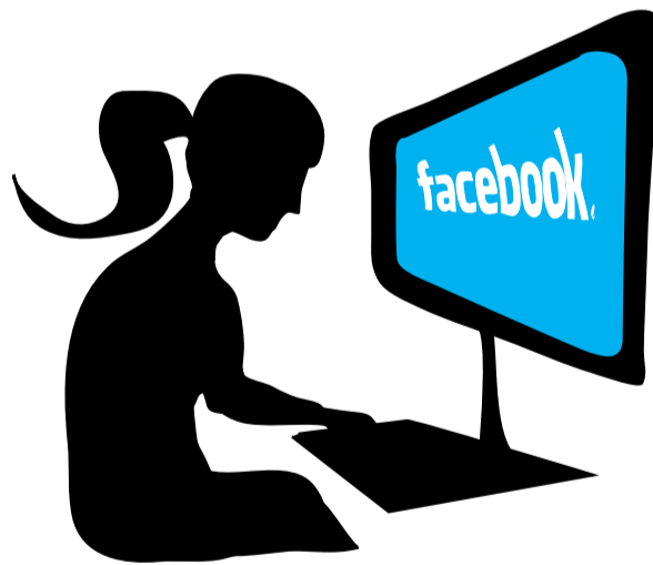
ILLUSTRATION: ANNA ERICSSON